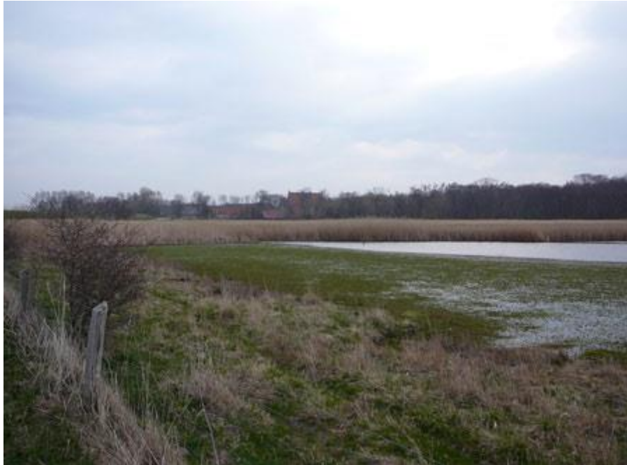
Borreby Mose.

En af Sjællands bedste lokaliteter for vandfugle Se Google-map med P-pladser m.v.