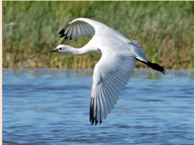
Skestork – Vejlerne, Jylland

Årsag hertil har grundlag i flere medlemspåklager om oplevet svag tale, der giver manglende forståelse under afholdt Generalforsamlinger.