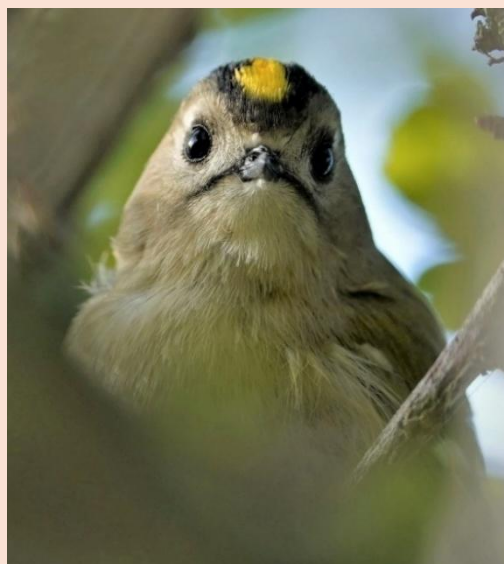
Fuglekonge - Tårnberg, Korsør