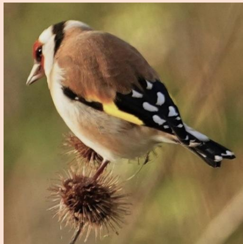
Stillits - Bjørnebæk Sø, Næstved