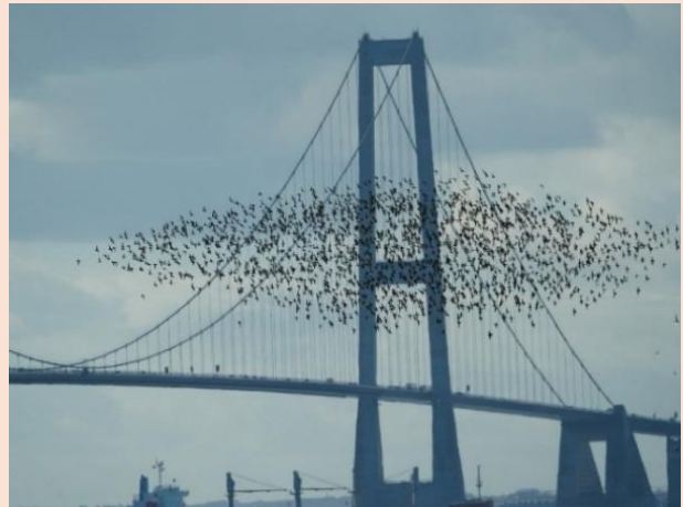
Hjejler - over Storebæltsbroen

DOF VSJ sluttede år 2024 med flot kassebeholdning på: