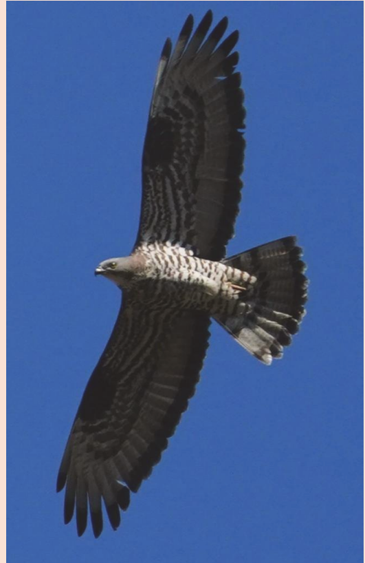
Hvepsevåge fra Holmegård Mose, Næstved