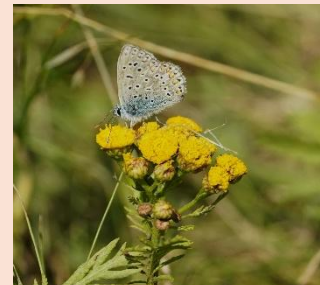
Alm. Blåfugl på en Rejnfan