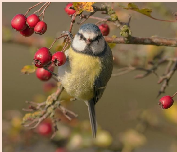
Blåmejse - Borreby Mose