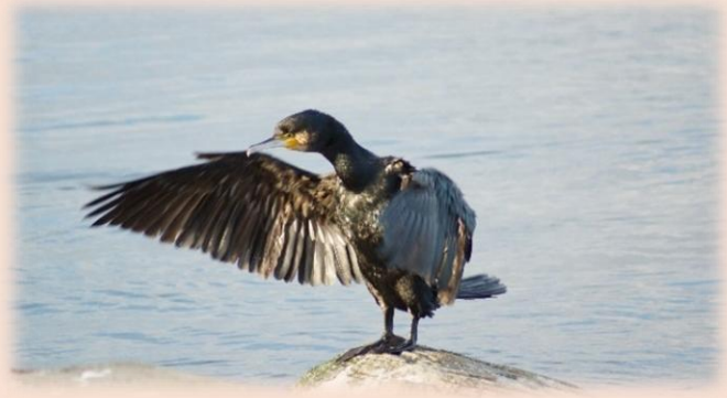
Skarv i Skælskør Nor

DOF VSJ har vision til opfyldelse, som er at bevare vores rigtigt gode DOF VSJ i al fremtid.