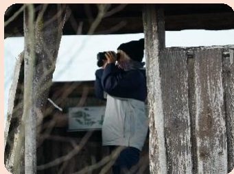
DOF VSJ-medlem i fugletårn