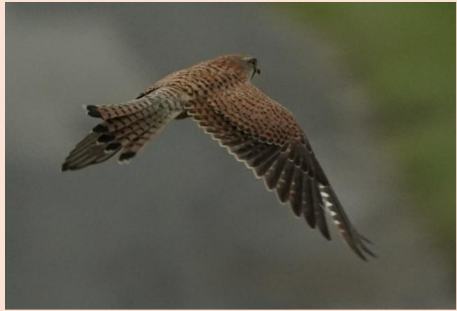
Tårnfalk i Borreby Mose

Ved afholdt DOF Repræsentantskabsmøde den 16. oktober 2024. Udmelder DOF-direktør Sigrid, om et truende økonomianliggende hos DOF. Som kræver akut handling fra Repræsentantskabet.