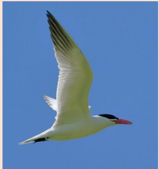
Rovterne - Broksø Enge Næstved