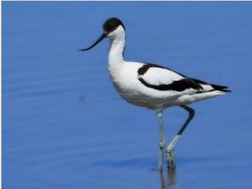
Klyde – Borreby Mose

I DOF VSJ kan du fx opleve mange aktive fuglefolk, som arbejder ihærdigt for at tilsikre, den bedste naturoplevelse i Vestsjælland for mennesker, fugle, insekter og fauna.