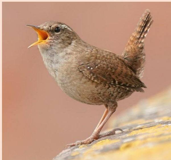
Gærdesmutte - Borreby Herreborg.