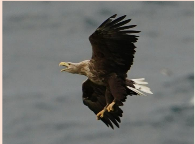
Havørn – Runde Norge

Set af den gode afvikling gennem årene, har der igen lydt tilfredse tilbagemeldinger fra deltagerne på Ørnens Dag 2024.