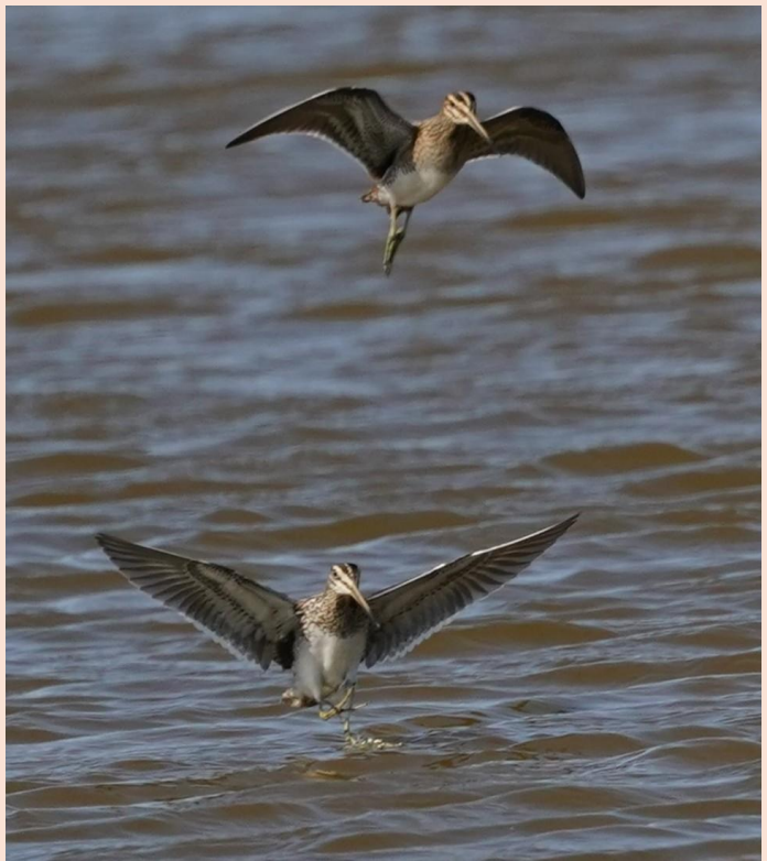
Dobbeltbekkasin - Borreby Mose