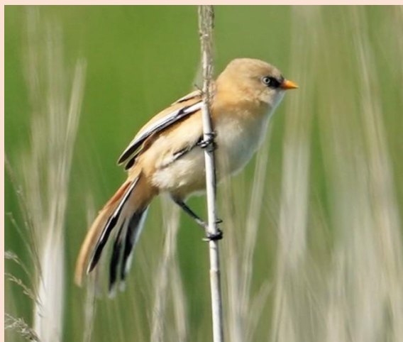
Skægmejse i Borreby Mose

Evidens herfor ligger i DOF VSJ udfærdiget økonomioversigt for årene 2025 - 2028.