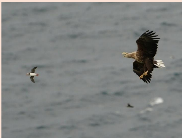
Havørn efter Lunde, øen Runde, Norge

DOF VSJ indgår som noget nyt, et konstruktivt samarbejde med Kalundborg Kommunes Kulturkoordinator for Fugledegård – Tissø.