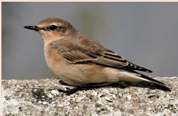
Stenpikker, Ballum Sluse, Sdr. Jylland