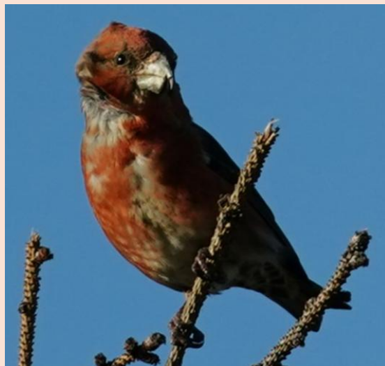
Stor Korsnæb – Melby Overdrev