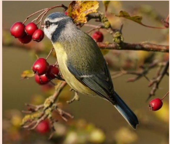
Blåmejse - Borreby Mose