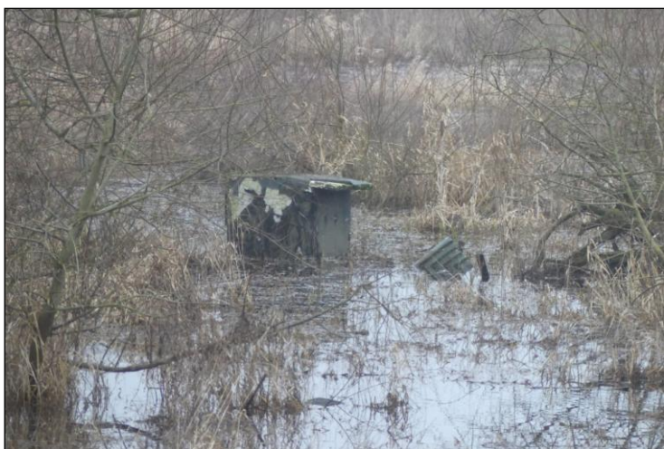
Isfuglekassen januar 2025.